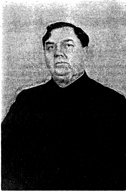
Г. М. Маленков.