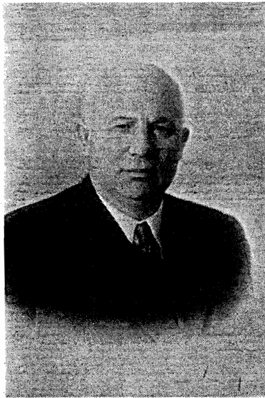
Н. С. Хрущев.

Совместное заседание Пленума Центрального Комитета КПСС, Совета Министров СССР и Президиума Верховного Совета СССР единогласно утверждает внесен-