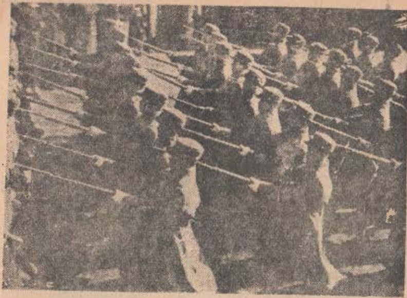
步兵部隊의 行進하는 光景