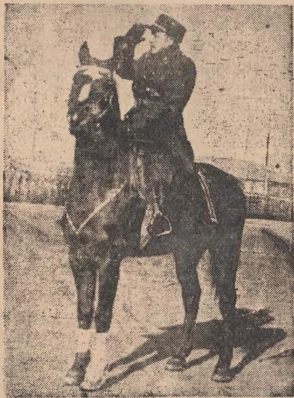
總司令 崔庸健 是騎兵