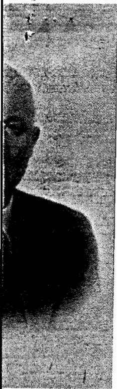
Н. С. Хрущев.

ные Бюро Президиума ЦК предложения о мероприятиях по организации партийного и государственного руководства (см. приложение) 4 .