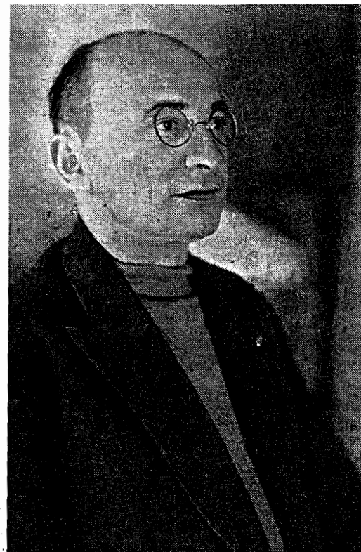
Л. П. Берия.

Комитета партии, Совета Министров Союза ССР, Президиума Верховного Совета СССР.