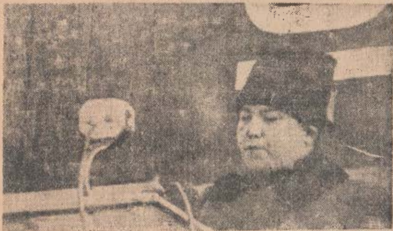
閱兵式場에서 演說하시는데 金日成委員長