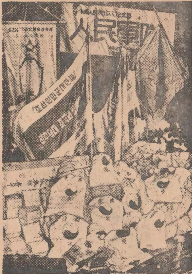
人民軍에게 보내온 山積한 人民들의 獻旗의 餽物