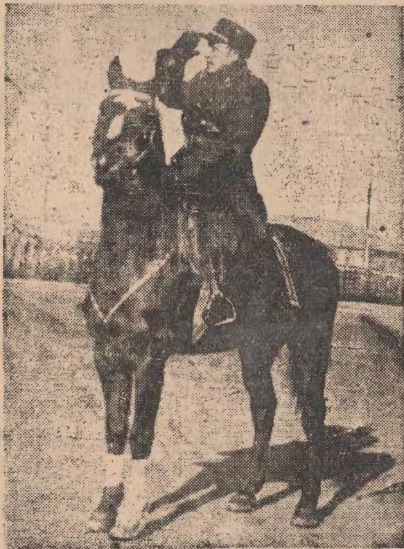
總司令 崔庸健 是時兵閱