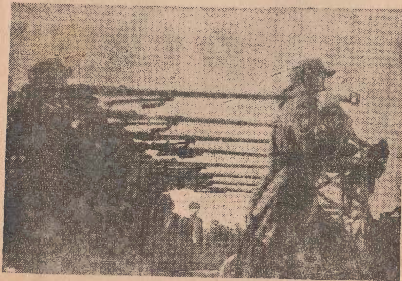
製戰車砲部隊의 行進하는 光景